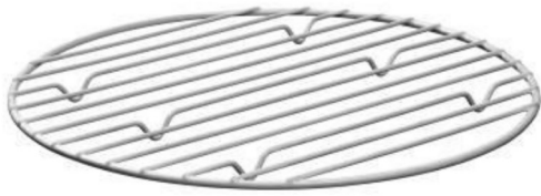
Rost, Ø 320 mm (im Lieferumfang enthalten)