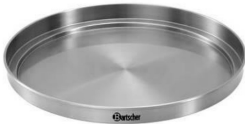
Warmhaltedeckel für Tassen ( nicht im Lieferumfang enthalten)

geeignet für ca. 10 – 15 Tassen Material: Edelstahl Ø 400 mm, Randhöhe: 39 mm Gewicht: 0,76 kg