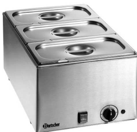
200.233 3 x 1/3 GN