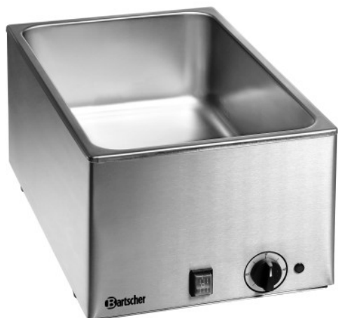
200.230 1 x 1/1 GN