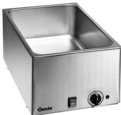
200.230 1 x 1/1 GN