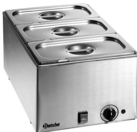
200.233 3 x 1/3 GN