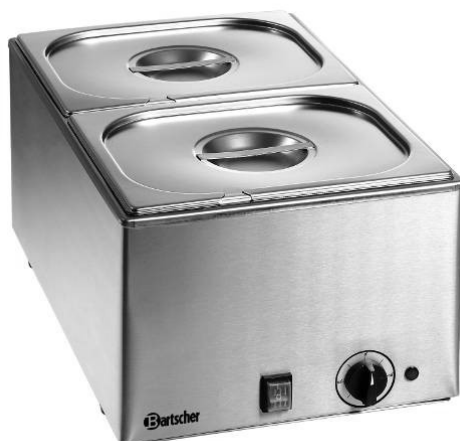
200.232 2 x 1/2 GN